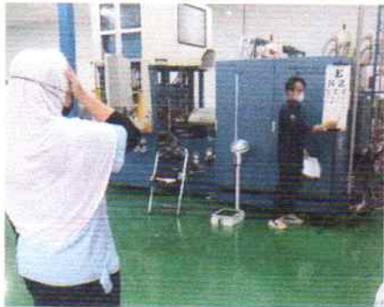
Pemeriksaan Visus Mata