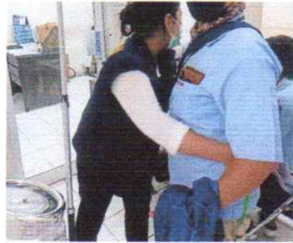
Pemeriksaan Lingkar Pinggang