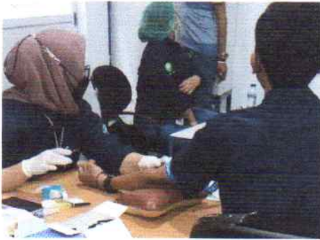
Pemeriksaan Tensi Darah