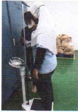
Pemeriksaan Tinggi Badan