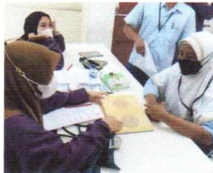
Pemeriksaan Buta Warna