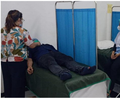
Pemeriksaan Dokter (Fisik)