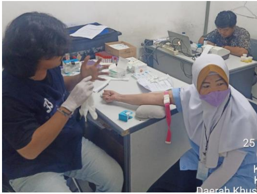
Pengambilan Sampel Lab Darah