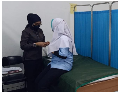
Pemeriksaan Dokter (Fisik)