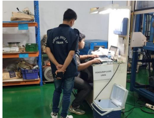
Pengambilan Sampel Lab Urine